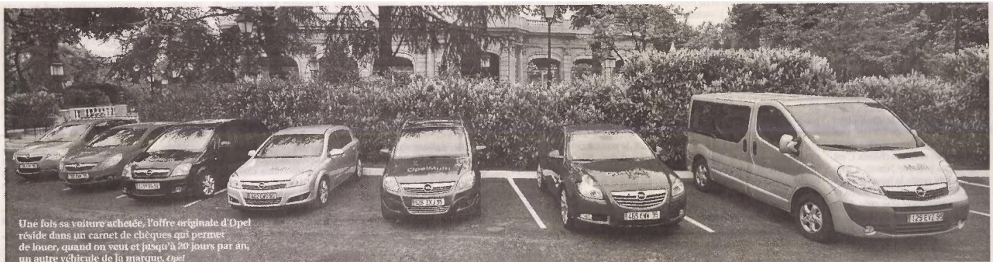
Une fois sa voiture achetée, l'offre originale d'Opel réside dans un carnet de chèques qui permet de louer, quand on veut et jusqu'à 20 jours par an, un autre véhicule de la marque Opel.